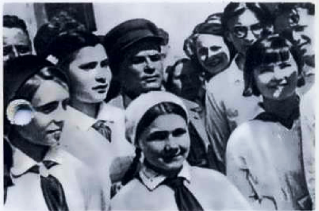
Сергей Миронович Киров среди ленинградских пионеров. 1934 год.