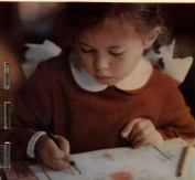
А. Островский, Дарственная школе Алматы Биострате